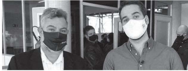
Prefeito lavrense esteve presente durante ato de início das obras

inicia a tão sonhada e polêmica obra, vai de Bagé até a localidade de Torquato Severo, aproximadamente 22,7km e tem previsão de conclusão até o final de 2022. O investimento é de R$ 35,34 milhões.