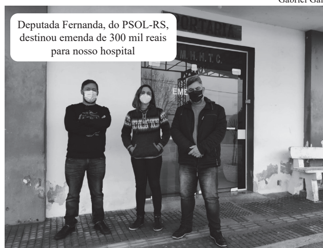
Deputada Fernanda, do PSOL-RS, destinou emenda de 300 mil reais para nosso hospital

recursos para o hospital pelo trabalho de referência que tem feito e pela necessidade apontada pelos militantes do PSOL na cidade”, afirma Fernanda. De acordo com o prefeito, os recursos destinados pela deputada tornarão possível agilizar o atendimento no município. “Lavras depende muito das cidades da região na área da saúde e a alocação de recursos no hospital ajudará a dar conta da demanda”, explica.