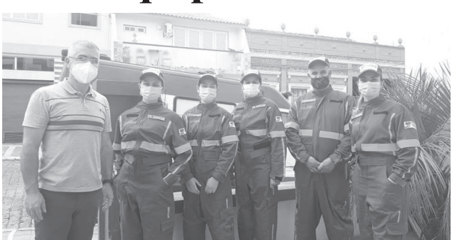
Secretário realiza entregue dos novos uniformes

A equipe da UTI MÓVEL – Urgência e Emergência, recebeu, através da Secretaria Municipal de Saúde, novos uniformes. No dia 05 de abril, foram entregues aos integrantes da equipe da UTI Móvel, 10 uniformes, distribuídos entre enfermeiros, técnicos em enfermagem e motoristas.