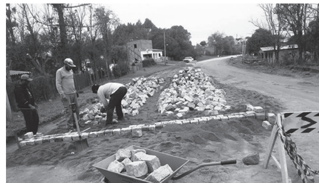
Obra de calçamento do Bairro Cerrito já se encontra em fase adiantada

Em agosto, teve início o calçamento estrutural da estrada do Cerrito. O maior anseio da comunidade que reside no local e que, finalmente, saiu das antigas promessas políticas e tomou forma. O projeto consiste no calçamento com paralelepípedos, com uma extensão de mais ou menos 400 metros. O investimento da obra gira em torno de 500 mil reais e os recursos são oriundos de emendas federais parlamentares. A pavimentação dessa via é fundamental para os moradores do Cerrito. Há incontáveis e incansáveis anos, os moradores do bairro, sofrem com as péssimas condições da estrada, bem como, poeira e todos os problemas que ela acarreta.