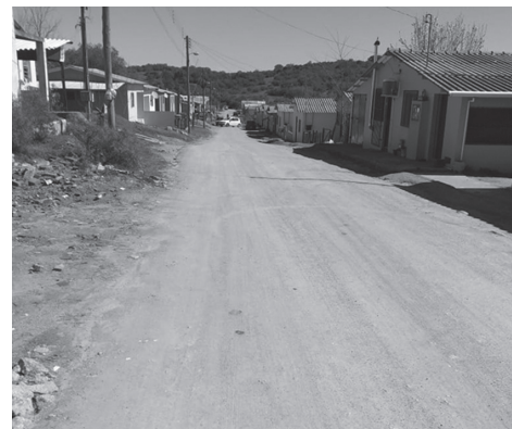
Rua Herondina de Castro – Bairro Alto Alegre