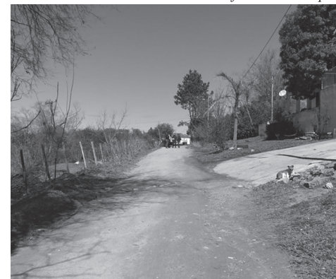
Rua Adílio Contti