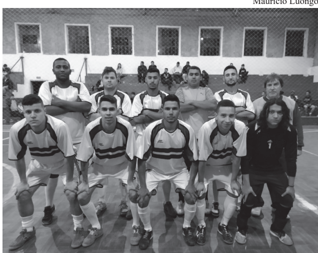
Equipe do Independente venceu o amistoso pelo placar de 8x3

Atualmente, a Sociedade Esportiva Independente está em intenso preparo e suces-