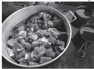
Todas as refeições servidas durante o evento, são gratuitas

Os projetos para os 20 anos da Semana Farroupilha do Ibaré, já estão no papel e nos pensamentos do casal e toda a equipe que ajuda a fazer dessa fes-