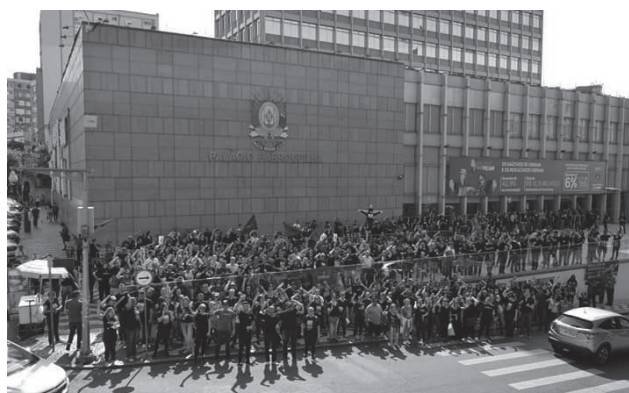
Servidores do judiciário em manifestação em frente a Assembleia Legislativa

"Com essa proposta do projeto de lei, além de impedir uma prospecção de progredir no cargo, inviabiliza ainda mais a possibilidade de um plano de carreira, do qual, atualmente, não possuímos. Temos ainda, um