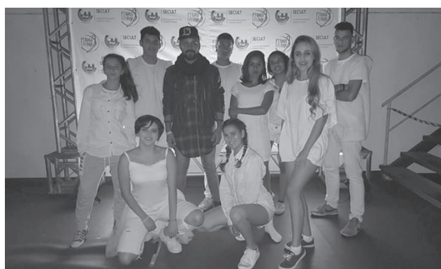
Grupo Vem Dançar é um dos maiores representantes do segmento em nosso município

"Sabemos o quanto é importante os festivais de dança, tanto para os grupos, quanto para nossa cidade, pois além de fazer esse intercâmbio cultural, acaba mostrando um novo