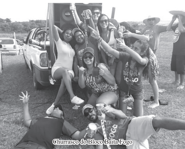
Churrasco do Bloco Baixa Fogo