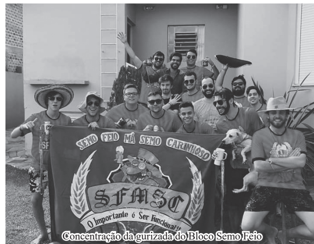
Concentração da gurizada do Bloco Semo Feio