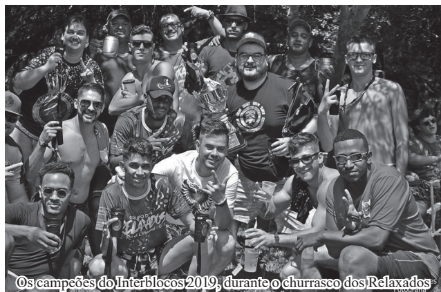
Os campeões do Interblocos 2019, durante o churrasco dos Relaxados