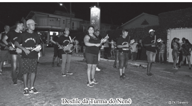
Desfile da Turma do Nenê