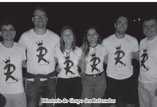
Diretoria do Grupo dos Relaxados