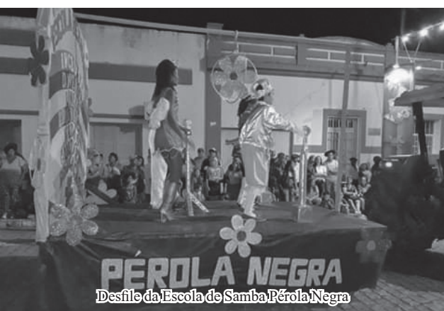
PÉROLA NEGRA Desfile da Escola de Samba Pérola Negra