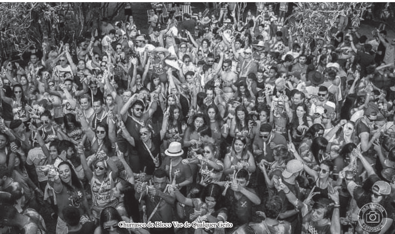
Churrasco do Bloco Vae de Qualquer Geito