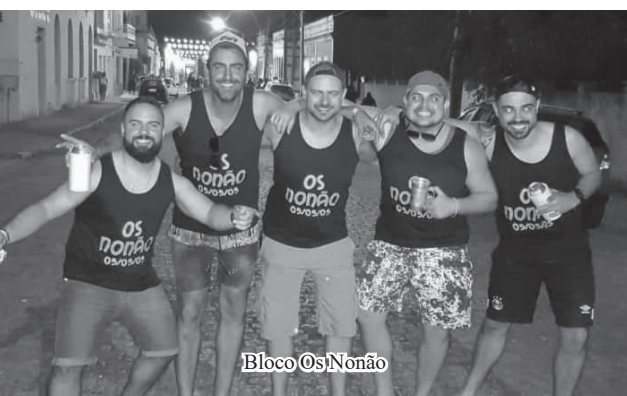
Bloco Os Nonão