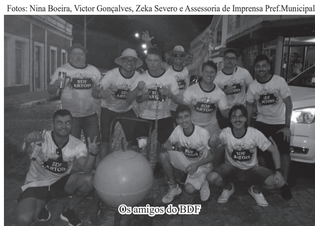
Os amigos do BDF