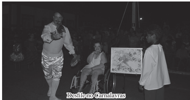
Desfile no Camalavras