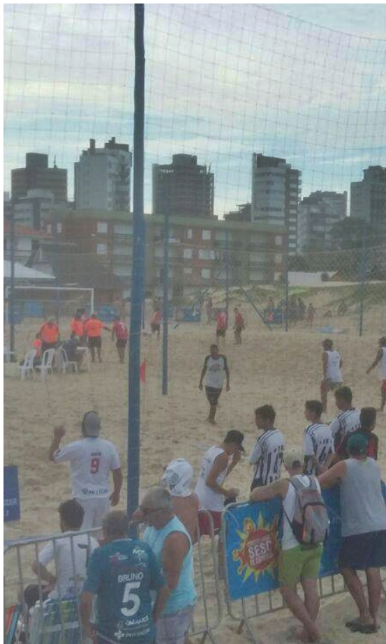
Lavrenses em Circuito Verão Sesc de Esportes 2017