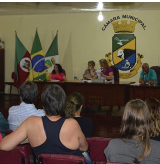
Mesa Diretora - Câmara de Vereadores de Lavras do Sul