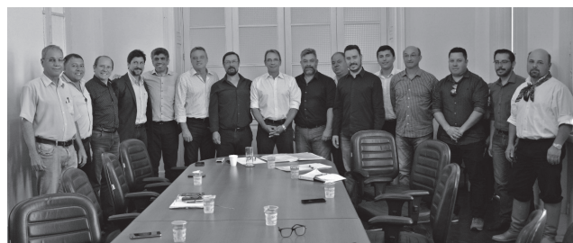
Assembleia do CODEPAMPA

O CODEPAMPA foi criado para integrar e desenvolver as regiões Campanha e Fronteira Oeste. O consórcio tem seus propósitos ligados diretamente à defesa dos interesses intermunicipais, bem como ao estabelecimento de cooperação técnica e financeira para o implemento de obras, serviços e políticas públicas