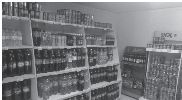
Novo espaço Bier.