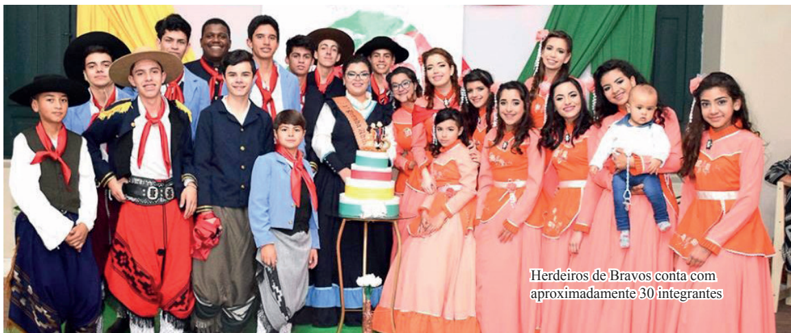
Herdeiros de Bravos conta com aproximadamente 30 integrantes