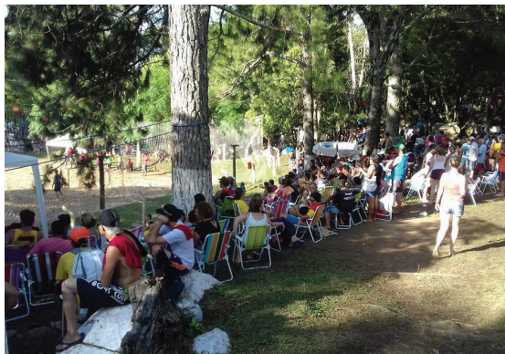
Sol e calor no segundo dia do evento