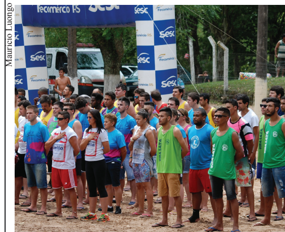
Solenidade de abertura do Interblocos