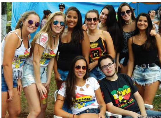
Só alegria nos dois dias do Interblocos