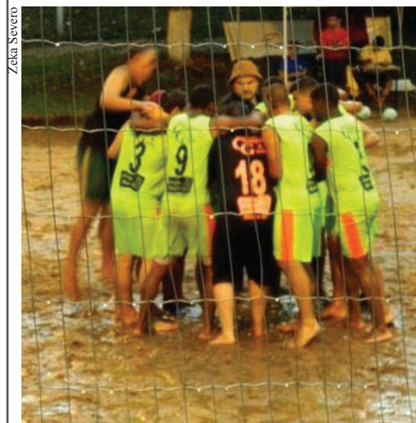
Bloco Os Não