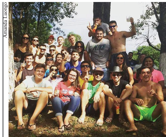
Grupo do "+ 1" também se fez presente

Semana que vem eu volto, amigos. Até lá!